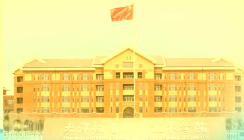
天津机电职业技术学院 TIANJIN VOCATIONAL COLLEGE OF MECHANICAL AND ELECTRICAL ENGINEERING